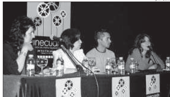
LA RODA DE PREMSA DE PRESENTACIÓ DE LA SEGONA MOSTRA DE CINEMA EQUATORIÀ