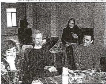
Pensar el moviment 2005.

CalderaExpress organiza desde ya hace ocho años encuentros internacionales alrededor de una idea o de un artista.